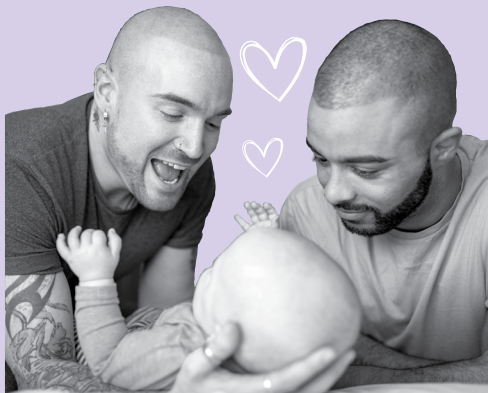
Platiquen conmigo, así me ayudan a desarrollar mi cerebro.

Su bebé comenzará a sentirse más cómodo con las personas con las que pasa más tiempo y más ansioso con personas extrañas. Recuerde a todas las personas que cuidan a su bebé lo importante que ellos son para su bebé.