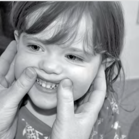
Levanta mis labios y busca manchas en mis dientes.

Si su niño no ha tenido su primera revisión dental, ya es hora de hacerlo. Llame al dentista de su niño para hacer una cita. Para recibir ayuda para encontrar un dentista llame a la línea de ayuda Family Health al 1-800-322-2588 o visite bit.ly/SaludDentalDeLosNiños