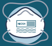
እንደሚገባም የተመረመረ N95 መተንፈሻ

*የሚፈለገው የግል መከላከያ መሣሪያ በሚፈለገው የመገለጫ ጥንቃቄ ላይ ተመሰርቶ ይለያያል። የግል መከላከያ መሣሪያውን እና የደረጃዎች ቅደም ተከተል የጥንቃቄ ደረጃን ለማስማማት ይለውጡ።