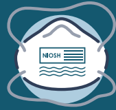
እንደሚገባም የተመረመረ N95 መተንፈሻ