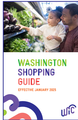
새로운 장보기 가이드

이 가이드를 통해 WIC 추가 승인 식품 업데이트에 대해 더 자세히 알아보세요.