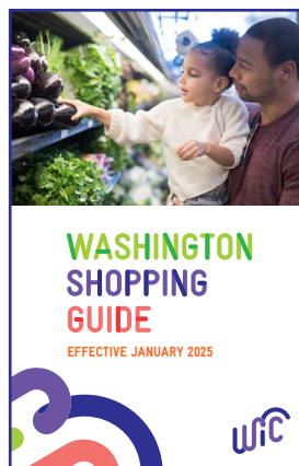
MWONGOZO WA MPYA WA MANUNUZI WA WIC

Tafadhali tumia mwongozo huu ili kujifunza zaidi kuhusu masasisho ya vyakula vyetu vya WIC vilivyoidhinishwa.