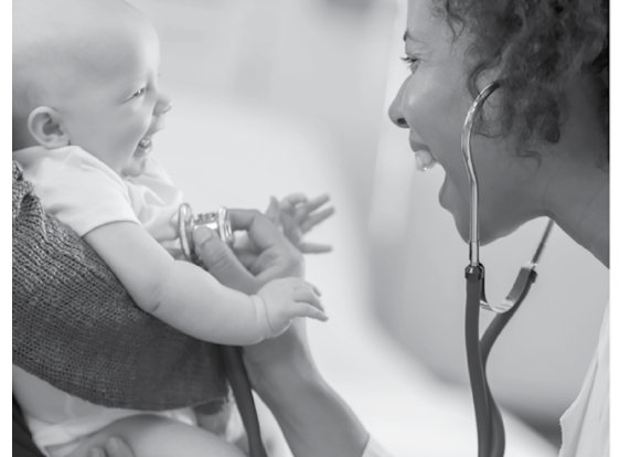
Programa mi revisión médica de los 4 meses.

La revisión médica de los 4 meses es el momento perfecto para hacer cualquier pregunta sobre la salud, el crecimiento, el desarrollo y las vacunas de su bebé. Tome notas durante la visita médica y compártalas con las personas que cuidan a su bebé.