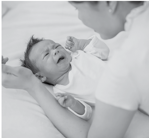
Si lloro muy seguido, pide ayuda.

Comparta su plan con todas las personas que cuidan a su bebé. Asegúrese que sepan que nunca deben sacudir al bebé y que se comuniquen con usted de inmediato, si se sienten frustrados o abrumados.