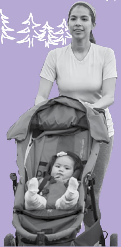
¡Salgamos a caminar juntos!